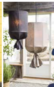
Snygg lampa för uterummet. Kommer från PB Home och kostar ca 799-999 kr.