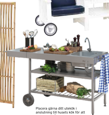
Placera gärna ditt utekök i anslutning till husets kök för att lätt kunna gå emellan. Utekök från Purus, pris ca 13 900 kr.