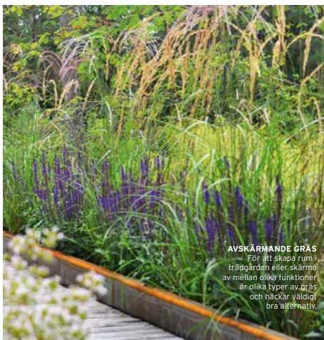
AVSKÄRMANDE GRÄS För att skapa rum i trädgården eller skärma av mellan olika funktioner är olika typer av gräs och häckar väldigt bra alternativ.