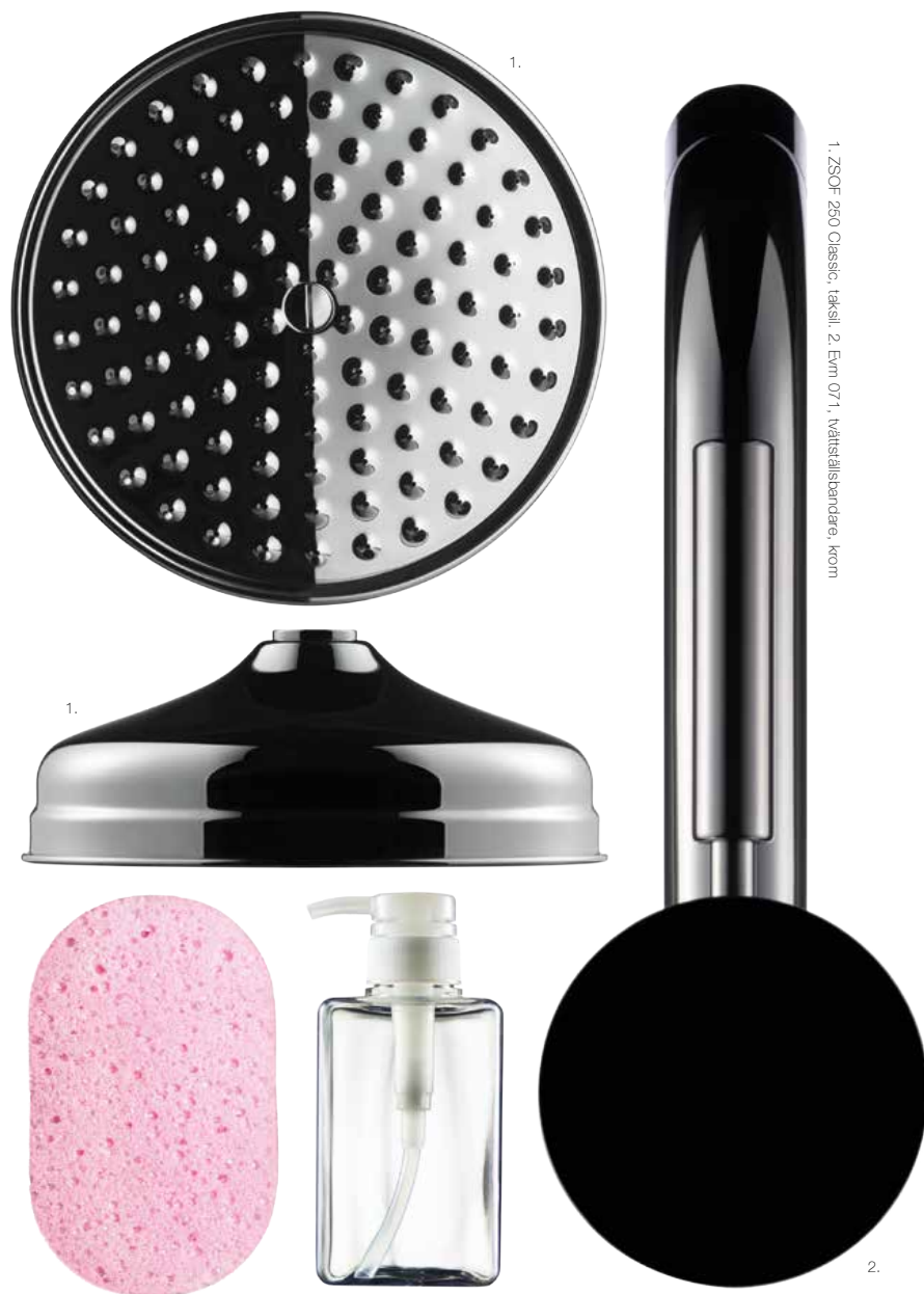
1. ZSOF 250 Classic, fäksli, 2. Evm 071, vätsstillskändare, krom

Tapwell Water through good design. www.tapwell.se