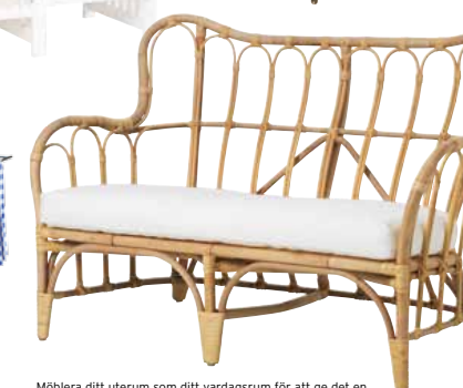
Möblera ditt uterum som ditt vardagsrum för att ge det en avslappnad känsla. Sofa Mastholmen från IKEA, pris 1 695 kr.