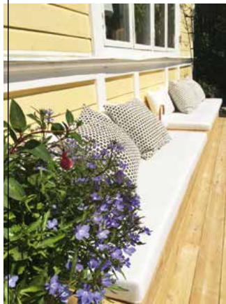
PLATSBYGGT I en mindre trädgård är det bra att satsa på platsbyggda möbler som tar mindre plats och som lätt går att integrera med den omgivande miljön.