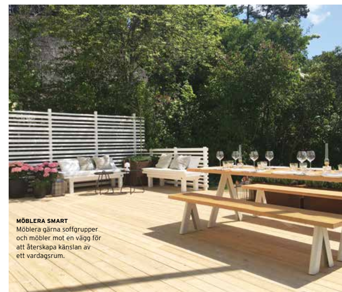
MÖBLERA SMART Möblera gärna soffgrupper och möbler mot en vägg för att återskapa känslan av ett vardagsrum.

3 STRÄVA EFTER att skapa en rums känsla. Tänk på hur du inreder ett vardagsrum och försök tänk likadant med utemiljön. Inred med kuddar, pläddar och lyktor. Försök sudda gränserna mellan inne och ute. Skapar en trevlig och ombonad känsla. Skärma av mellan olika funktioner. Möblera soffgrupper mot väggar för att skapa vardagsrums känsla.