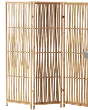
Skapa rum med hjälp av skärmväggar. Skärmväggen JASSA kommer från IKEA, pris 599 kr.