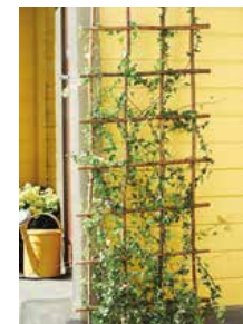
Låt dina växter klättra på en spaljé som också går att använda som rumsavdelare i trädgården. Cirka pris 120 kr, från Nelson Garden.