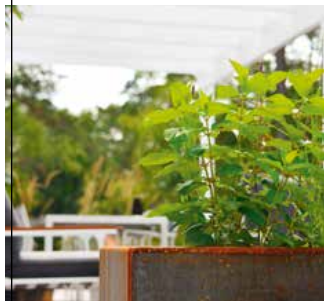
TÄTT MATERIAL Cortenstål är ett tåligt och snyggt material som just nu används mycket i de svenska trädgårdarna.