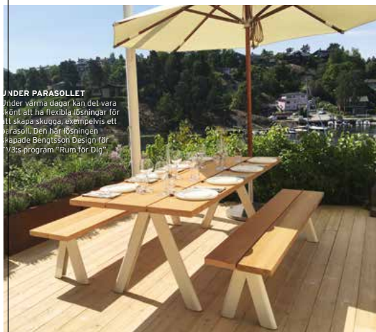
UNDER PARASOLLET Under värma dagar kan det vara värt att ha flexibla lösningar för att skapa skugga, exempelvis ett parasoll. Den här lösningen hälsade Bengtsson Design iår i S:s program "Rum för Dig".